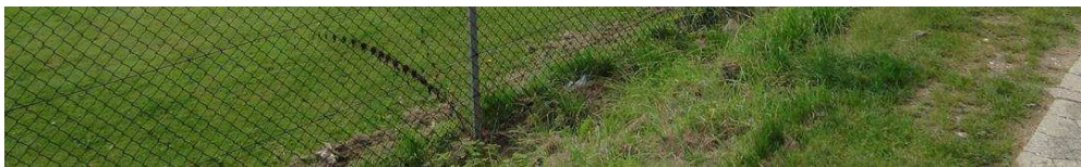
Fodboldbanen på Månedsstien i Hareskovby. Her planlægges en ny kunststofbane.