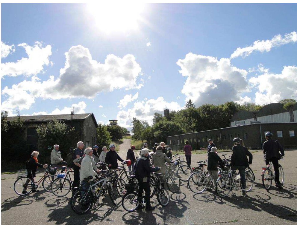
Cykeldag på Flyvestationen

Det er et stort ønske fra fodboldklubberne, at der anlægges flere kunstgræsbaner med lys, da dette udvider de perioder, hvor der kan spilles. Desværre giver anlæg af kunstgræsbaner anledning til flere problemer. Det er et generelt problem, at drænvandet fra en kunstgræsbane indeholder flere giftstoffer, der kan nå drikkevand og søer. Den påtænkte kunstgræsbane med lysanlæg i Hareskovby vil desuden ikke overholde den nyligt vedtagne lokalplan. DN Furesø ser med bekymring på risikoen for forurening af drikkevandet og søerne. Vi har derfor klaget over Kommunens VVM screeningsafgørelse. Du kan læse hele klagen her .