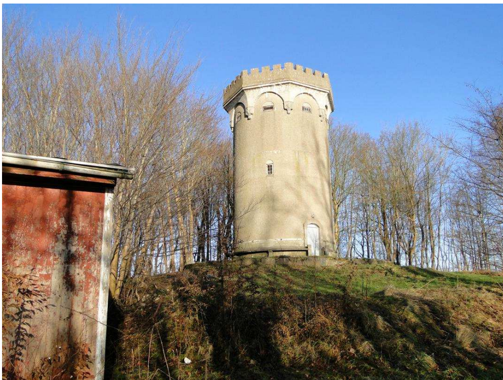
Tårnet på Laanshøj.

DN Furesø har deltaget i møder og besigtigelser i forbindelse med debatten om udbygningen af Laanshøj. Læs DN Furesøs hørings svar til Kommunen på hjemmesiden. Hørings svar .