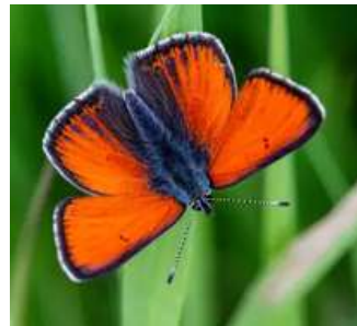
Violetrandet Ildfugl, han

For eksempel lægger Violetrandet Ildfugl (næsten udryddet på Baunesletten) kun sine æg i Almindelig Syre.