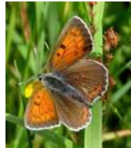
Violetrandet Ildfugl, hun