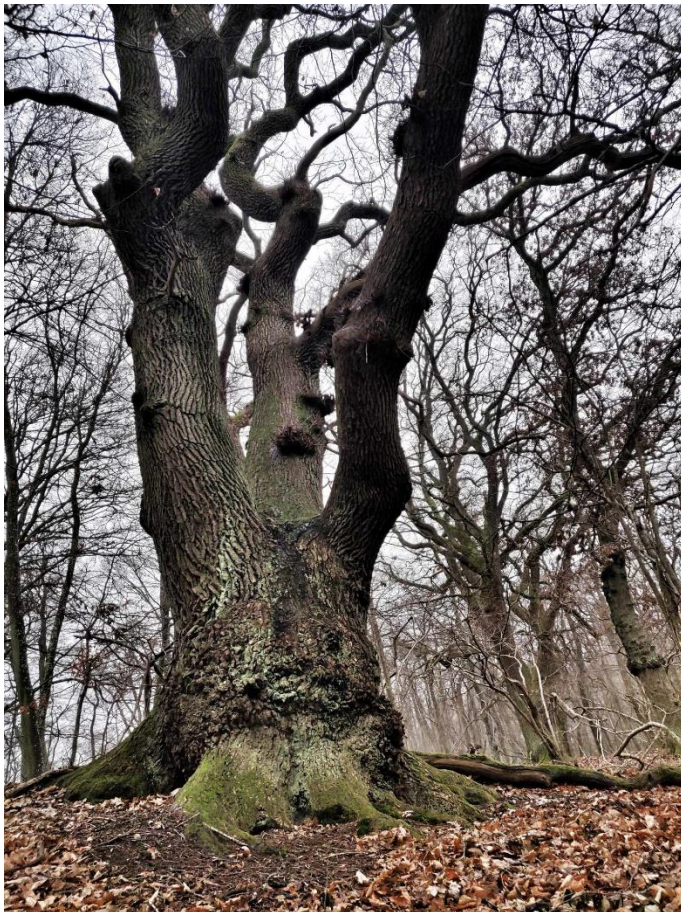
Egetræ på Dronningholm 2023. Engang det eneste træklædte område i Sortemosen.