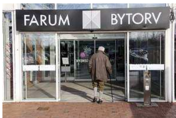
DEBAT: Hjemmevejleder: "Tak til personalet på Bytorvet"