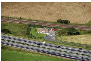
Havudsigt eller jernbane i baghaven? Dette afgør prisen på din bolig