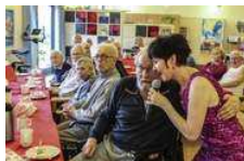
Lillevangs Venner fejrede 10 års jubilæum