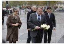
Statsministeren kommer til Brixtoftes bisættelse