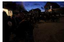
Så blev juletræet tændt i Farum