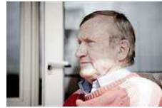
Brixtofte var en ukuelig fighter: Havde planer om politisk comeback