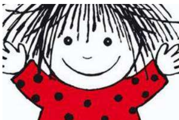
Biblioteket inviterer de mindste i biografen - gratis