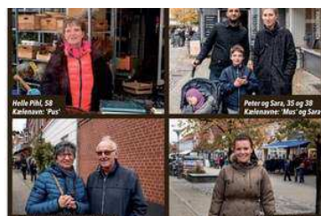
Kælenavne: Hvad bliver du kaldt derhjemme?