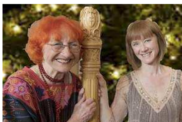
Julekoncert med et twist i Skovhuset