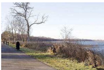
Naturformand: "Bevar freden og naturen langs Søndersø"