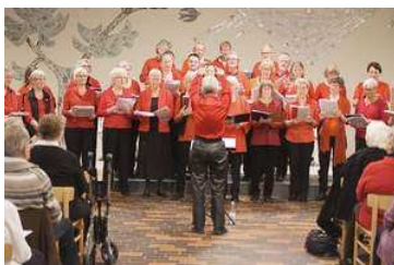
Værløse Koret synger julen ind