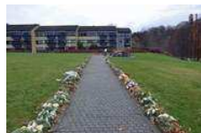
Blomster til Brixtofte pryder Skulpturparken