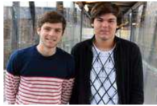
Kruse-elever er Danmarks bedste til spansk