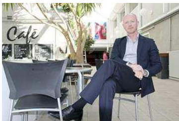
Venstre: "Luk Kilden nu"