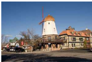
Foredrag om danskere, der udvandrede til USA